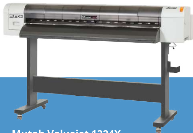
Mutoh Valuejet 1324X

Piezo Inkjet, kültéri UV tintával Maximum nyomtatható méret (tábla): 1016 mm x 1524 mm 8 szín: cyan, magenta, yellow, black, light cyan, light magenta, white, clear