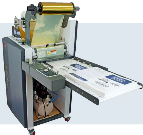
INTEC ColorFlare 1200

Lenyűgöző fémes fóliázást, laminálást és holografikus hatásokat ad a nyomatoknak