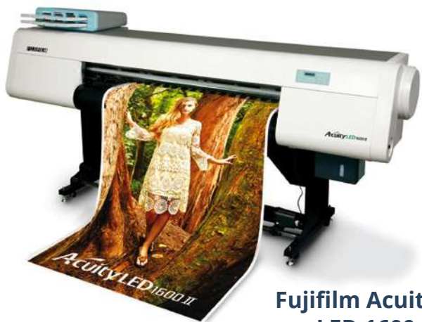
Fujifilm Acuity LED 1600-II

Piezo Inkjet, kültéri UV tintával Maximum nyomtatható méret (tábla): 1016 mm x 1524 mm 8 szín: cyan, magenta, yellow, black, light cyan, light magenta, white, clear