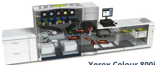
Xerox Colour 800i